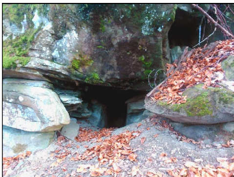
Vchod do jaskyne