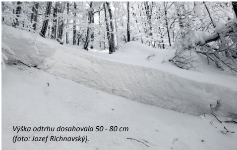
Výška odtrhu dosahovala 50 - 80 cm.

pili pred 14. hodinou a následne sa pustili strmým SSV svahom dolu, smerom k rašelinisku Hypkaňa. V mieste kde sa terén nápadne menil (zvyšoval sa sklon na konvexnom svahu) sa v jednom oblúku podarilo skialpinistke uvoľniť pomerne veľkú lavínu, ktorá ju strhla so sebou. Od miesta nájazdu sa odtrh šírila ďalších 65 m, pričom bol vysoký 50 - 60 cm, maximum dosahoval až 80 cm. Odtrh prebiehal na svahu so sklonom 40 - 47°. Uvoľnená lavína sa následne zosunula cez riedky bukový porast o 125 až 140 m až po okraj rašeliniska. Skialpinistka utrpela zranenia v dôsledku nárazu o niekoľko stromov, našťastie skončila len čiastočne zasypaná. V daný okamih boli nablízku manžel a kamarát, ktorí