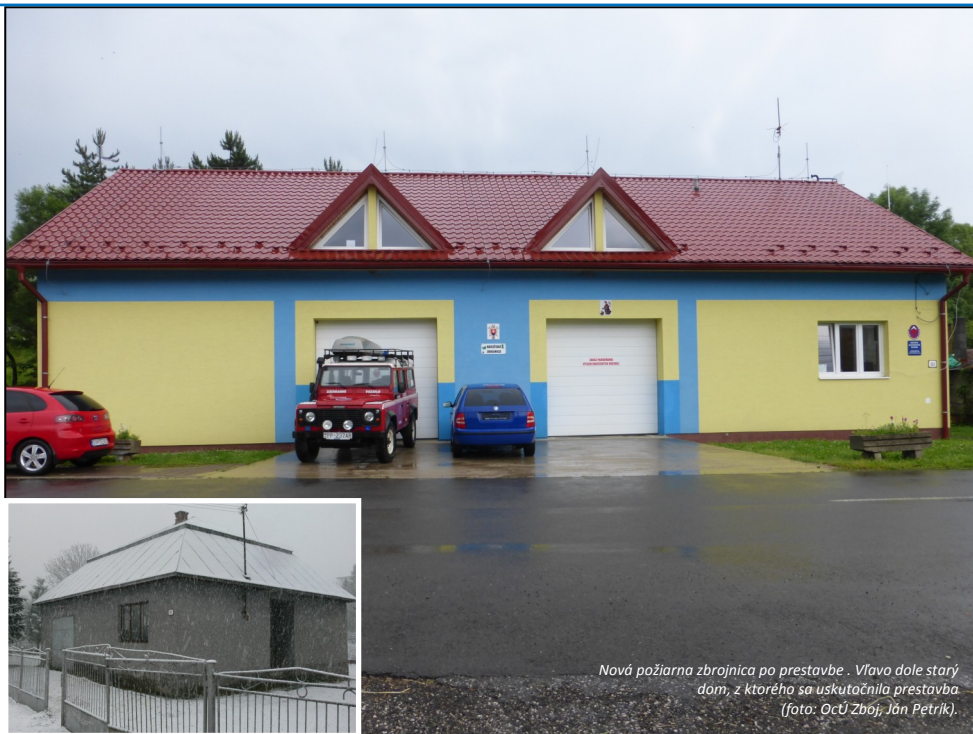
Nová požiarňa zbrojnica po prestavbe. Vľavo dole starý dom, z ktorého sa uskutočnila prestavba.