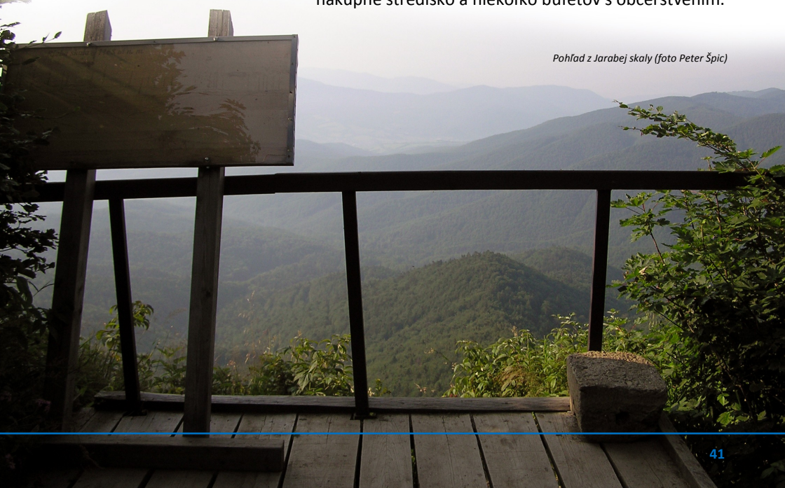
Pohľad z Jarabej skaly

V súčasnom Zboji (cca 400 obyvateľov) sídli pravoslávny farský úrad . V obci sa nachádza uhličitý prameň, ale aj prvá jaskyňa v sninskom okrese. Ďalej reštaurácia, nákupné stredisko a niekoľko bufetov s občerstvením.