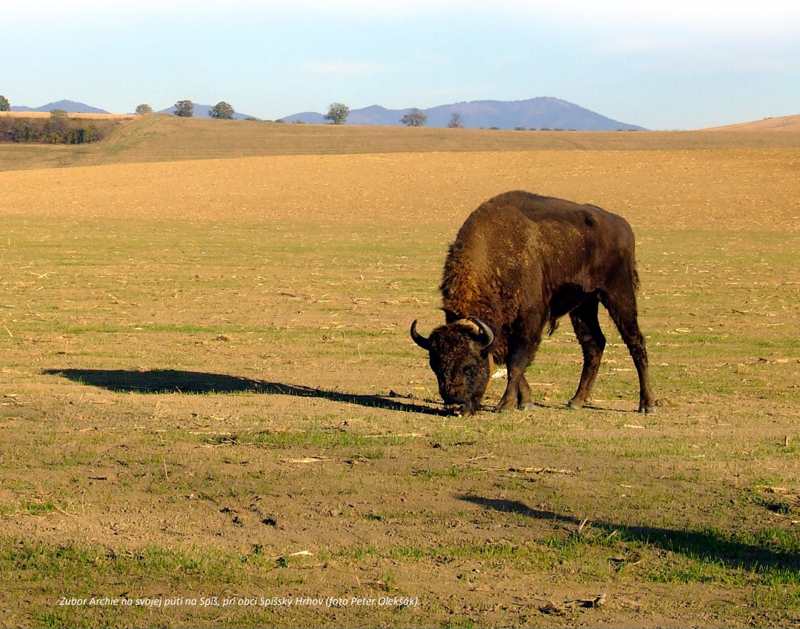
Zubor Archie na svojej púti na Spiš, pri obci Spišský Hrhov.