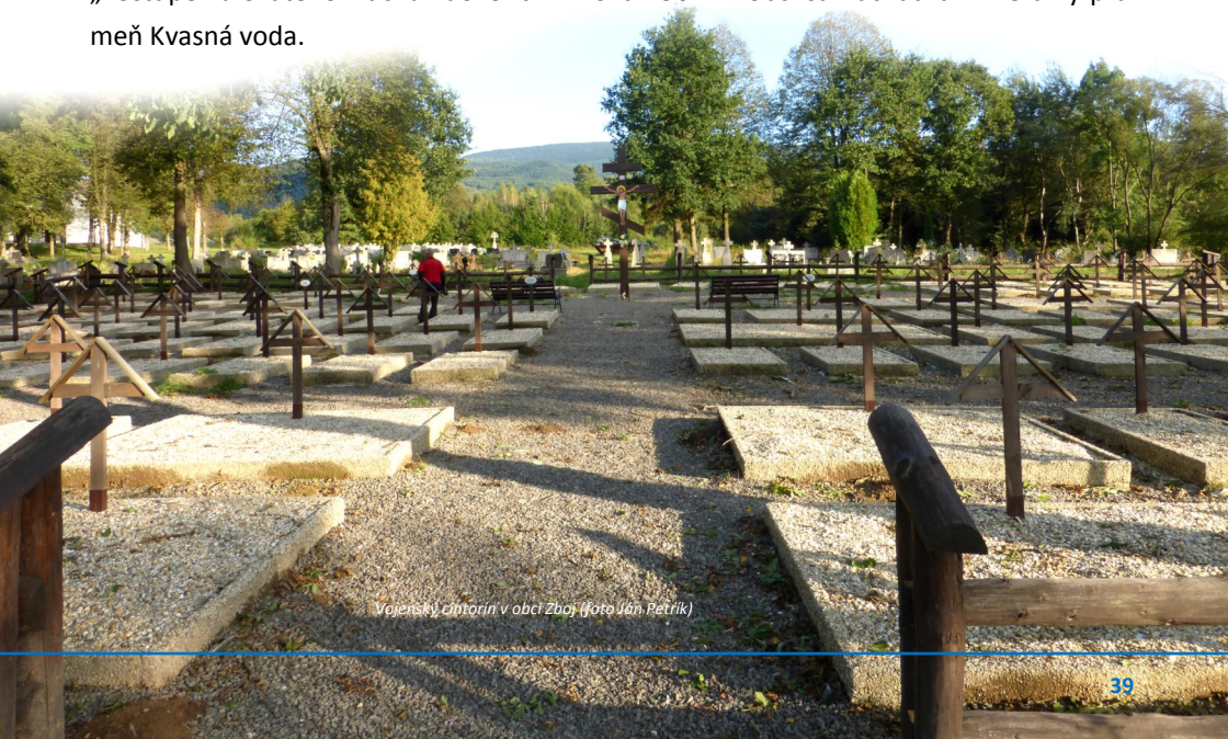
Vojenský cintorín v obci Zboj

Po 2. svetovej vojne sa 69 obyvateľov obce vysťahovalo za prácou do Čiech. V roku 1945 bola v obci zriadená lesná správa. Prvá autobusová linka do obce na trase Snina - Ulič - Zboj bola otvorená 17. júla 1947. V roku 1955 bol v obci zriadený poštový úrad. V roku 1960 bola dokončená elektrifikácia obce. Od roku 1973 hospodáril na tunajšej pôde LPM, š.p., Ulič. Drevená cerkva z roku 1706 bola v roku 1967 prevezená do Šarišského skanzenu v Bardejovských kúpeľoch. Nový, murovaný, pravoslávny kostol „Zostúpenia Svätého Ducha“ dokončili v roku 1964. V obci sa nachádza minerálny prameň Kvasná voda.