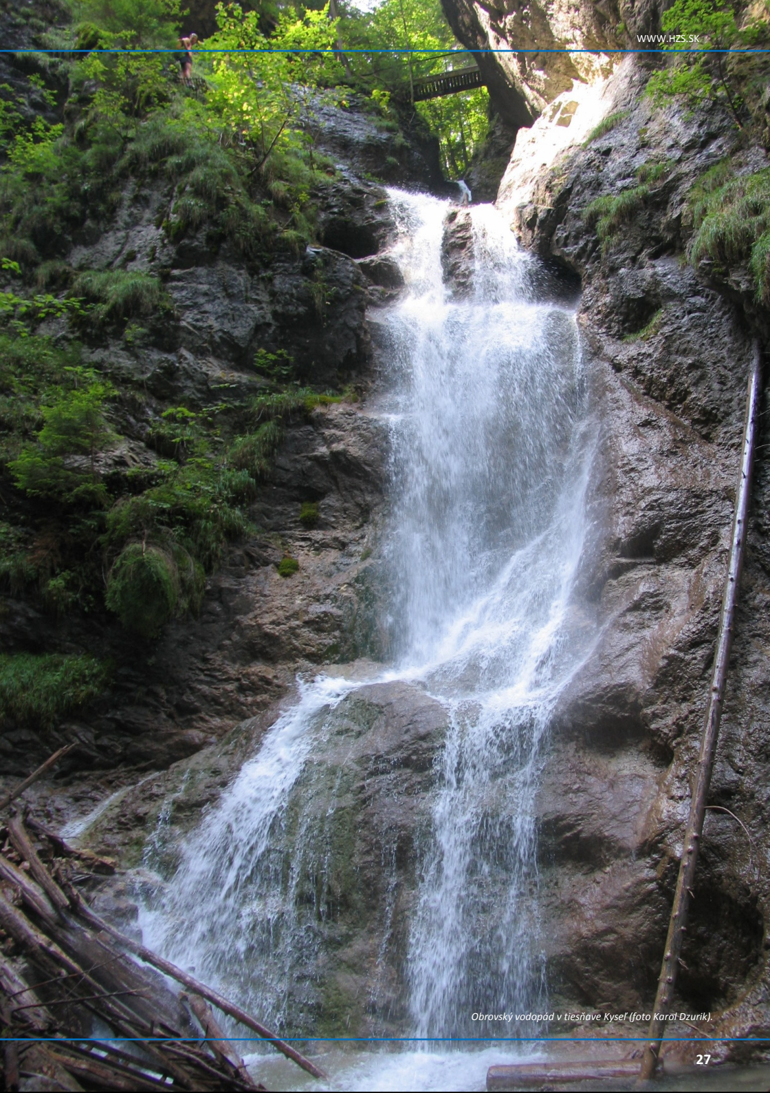
Obrovský vodopád v tiesňave Kyseľ.