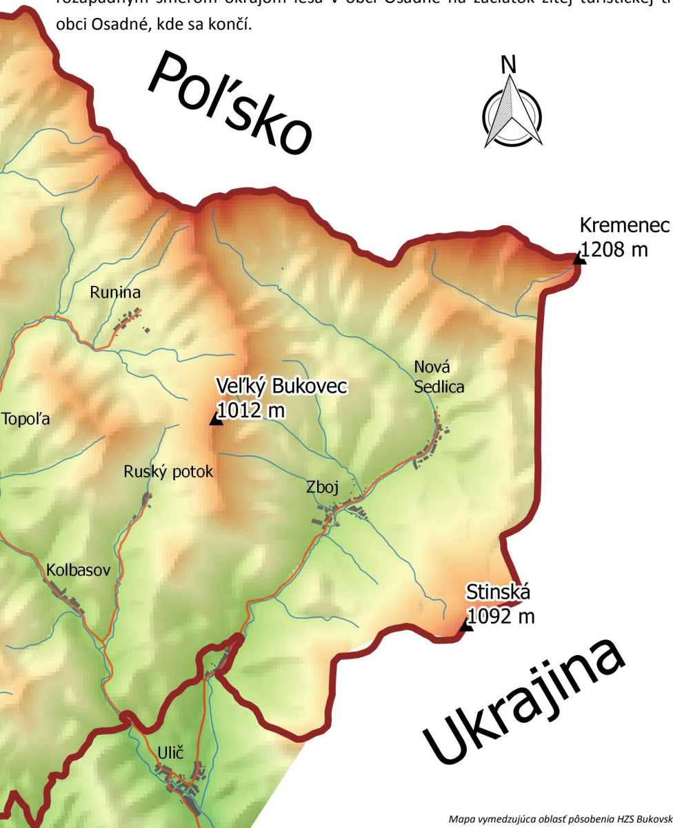
Mapa vymedzujúca oblasť pôsobenia HZS Bukovské vrchy.

Ďalej severozápadným smerom okrajom lesa v obciach Kalná Roztoka a Stakčína Roztoka a západným smerom okrajom lesa v obci Stakčín, kde hranica pretína cestu č. 558 a rieku Cirocha. Hranica pokračuje okrajom lesa v obci Stakčín na Mazúrov vrch, kde sa stáča na sever, pokračuje cez vrch Prípor a lesným porastom v obci Pčoliné cez vrchy Stavenec, Vrchpole a Kýčera. Hranica pokračuje okrajom lesa v obci Parihuzovce a severozápadným smerom okrajom lesa v obci Osadné na začiatok žltej turistickej trasy v obci Osadné, kde sa končí.