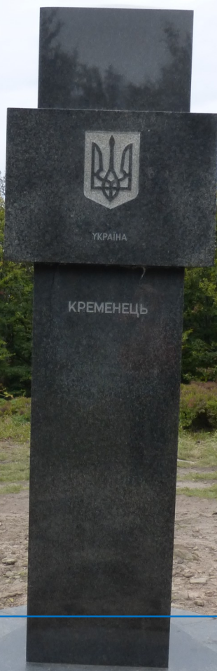
Kremenec najvýchodnejší bod Slovenskej republiky (foto Ján Petrik).

Táto nevel'ká publikácia si nekladie vysoké ciele. Účelom je oboznámiť obyvateľov Uličskej doliny, turistov a návštevníkov tunajších hôr so skutočnosťou vzniku oblasti Horskej záchranej služby (HZS) so sídlom v obci Zboj v roku 2017. Zoznámiť ich s jej úlohami, pôsobením vo vymedzenom priestore a personálnym obsadením. Poznať spôsoby, ako si privolať pri úraze v horách pomoc členov HZS. Založenie HZS Slovenský raj - horská oblasť Bukovské vrchy je opísaná v úvodných piatich kapitolách. V ďalších kapitolách táto publikácia stručne informuje o histórii Uličskej doliny a dejinách obce Zboj. V závere sa stručne venuje taktiež bukovým pralesoch Karpát a Národnom parku Poloniny. Všetky tieto kapitoly sú určené turistom a návštevníkom týchto krásnych hôr, pre ich všeobecnú a historickú orientáciu v teréne, v ktorom sa pohybujú. Približujú úžasnú, ale aj smutnú, vojnovú históriu oblasti Uličskej doliny a nefahký život jej obyvateľov.