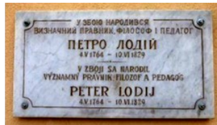
Pamätná doska na OcÚ v Zboji