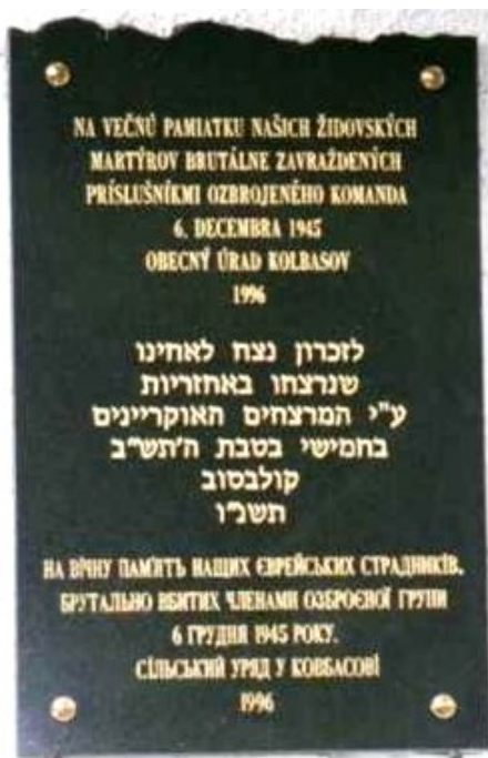
Pamätník pogromu na OcÚ v Kolbasove.

Pogrom (december 1945) - obec Zboj oslobodili vojská Červenej armády dňa 8. októbra 1944. Po podpise prímeria v máji 1945 sa aj územie východného Slovenska zabráte Maďarmi v roku 1939, vrátilo tam kam patrilo, do vtedajšieho Československa. Bohužiaľ, mier v Uličskej doline bol nejaký podivný. Na severných a severovýchodných svahoch Karpát (na Poľskej strane i na Ukrajine) táborili vojská Ukrajinskej povstaleckej armády - UPA, (tiež OUN) viac známe pod menom Banderovci 12 . A tie sa potrebovali živiť, bez jedla by neprežili. Vybrané jednotky UPA/OUN preto podnikali výpravy za jedlom aj na Slovensko. Na svojich cestách však brali obyvateľstvu nielen jedlo, ale šíрили aj svoju politickú agitáciu. Jej cieľom boli aj vtedy nepohodlní občania, resp. ich likvidácia, najmä komunisti a židia. „Agitácia“ názorne vyzerala takto: Prvou obeťou bol tajomník NV z Breznice pri Stropkove. Druhou bol židovský obyvateľ obce Zboj. Ďalšími obeťami boli obyvatelia Novej Sedlice. Potom to už išlo... a bolo to hrozné. Ulič 6. decembra 1945 štyria židovskí obyvatelia. V Kolbasove 6. decembra 1945 zavraždili 11 židovských obyvateľov. Hovorí o tom pamätná tabuľa na obecnom úrade. Čo sa vtedy vlastne stalo? Bola už noc, posledná noc židovského sviatku Chanuka, čiže Sviatku svetiel alebo Sviatku zasvätenia, kedy sa zapalujú sviečky na deväťtramennom svietniku, každý deň o jednu sviečku viac.