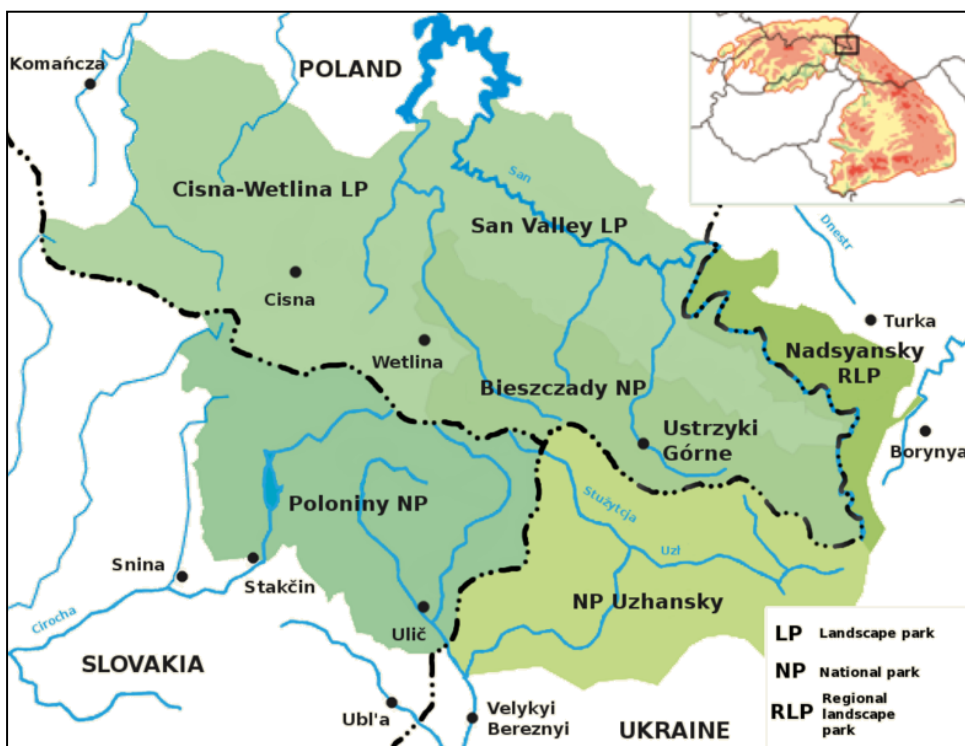
Mapa Medzinárodnej biosférickej rezervácie

V rokoch 1992 - 1993 bolo územie NP Poloniny zapísané do zoznamu medzinárodných biosférických rezervácií pod názvom MBR Východné Karpaty (East Carpathian Biosphere Reserve), spolu s príslušným územím v Poľsku (Bieszczadzki Park Narodowy, Cisniansko-Wetlinsky Park Krajobrazowy, Park Krajobrazowy Doliny Sanu). Stalo sa tak v rámci projektu „Človek a biosféra - Man and Biosphere“. V rokoch 1998 - 1999 boli k tejto biosférickej rezervácii pričlenené chránené územia na Ukrajine – (Užanskij nacionalnij prirodnij park) a (Nadsanskij regional'nyj landšaftnyj park), čím vznikla prvá trilaterálna biosférická rezervácia na svete a druhá najväčšia v Európe. MBR Východné Karpaty predstavuje mimoriadne bohatstvo medzinárodného významu. Tvoria ju 6 veľkoplošných chránených území na ploche 208 089 ha, z toho poľská časť zaberá 52,25%, slovenská časť 19,59 % a ukrajinská časť 28,16 %. Cieľom projektu „Človek a biosféra“ je skúmať vzťahy medzi prírodou a človekom a napomáhať k trvale udržateľnému životu a rozvoju.