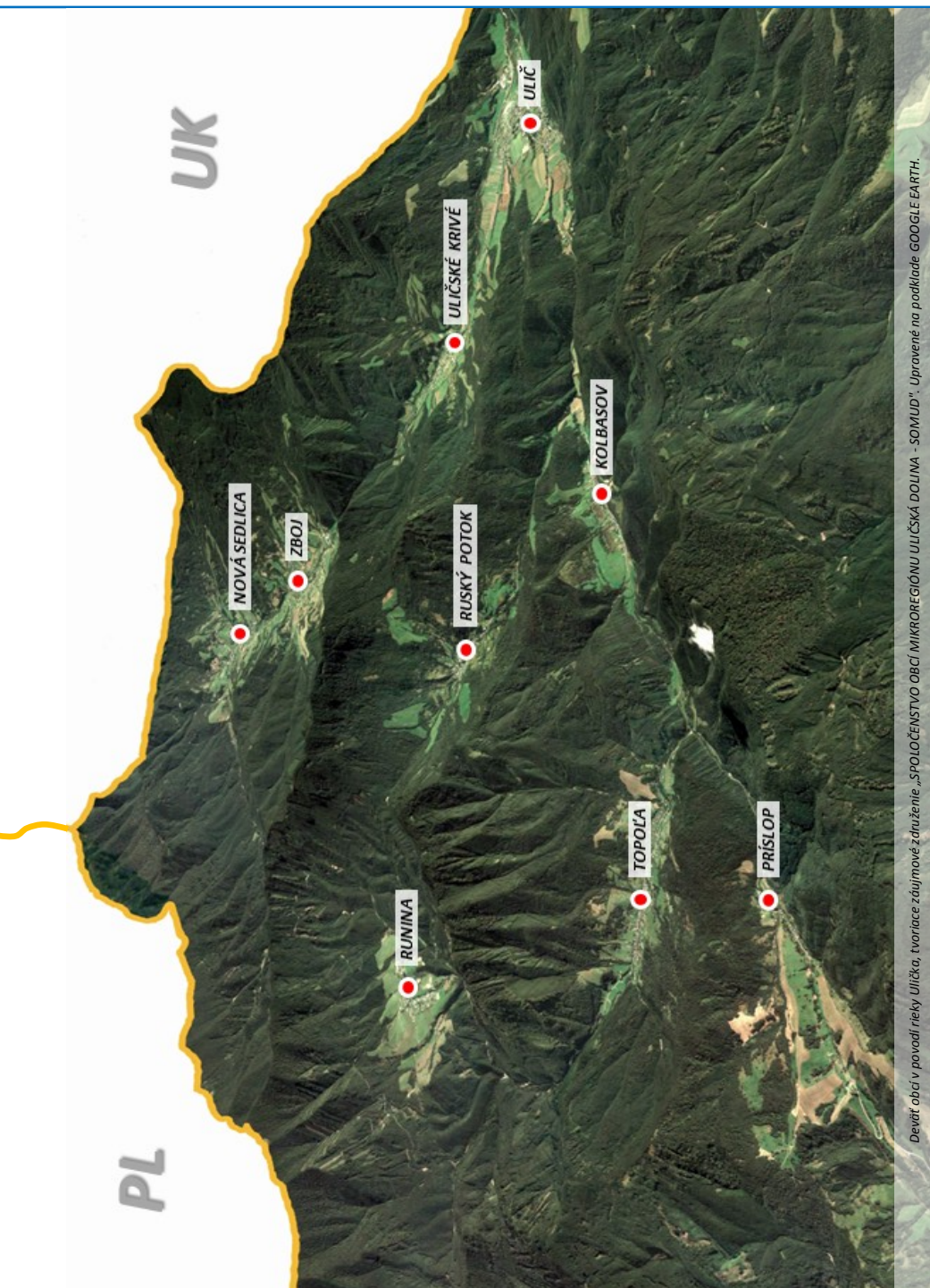
Deväť obcí v povodí rieky Ulička, tvoriace záujmové združenie „SPOLOČENSTVO OBČÍ MIKROREGIÓNU ULIČSKÁ DOLINA - SOMUD“. Upravené na podklade GOOGLE EARTH.