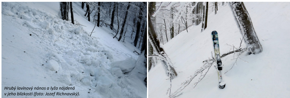
Hrubý lavínový nános a lyža nájdená v jeho blízkosti.

chrbtice neodkladnú zdravotnú starostlivosť. Následne ju za pomoci nosidiel UT 2000 a terénneho vozidla transportovali do obce Zemplínske Hámre, kde ju odovzdali privolanej posádke RLP na prevoz do nemocnice v Snine.