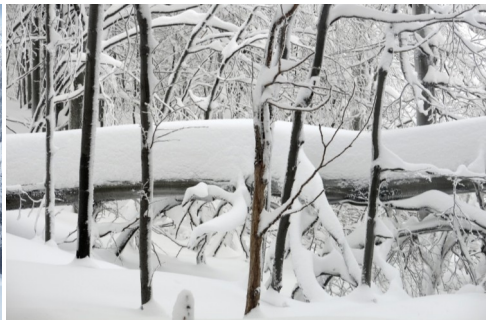
V oblasti Vihorlatských vrchov pripadlo 40 - 60 cm nového snehu.