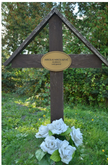
Hrob gen. N. N. Mirbacha v Uliči

Malá vojna - nešťastia nie je nikdy dosť! V marci 1939 postihla obyvateľstvo Uličskej doliny ďalšia, aj keď krátka, vojna, ale s veľkým dopadom na obyvateľov údolia. Vtedaj-