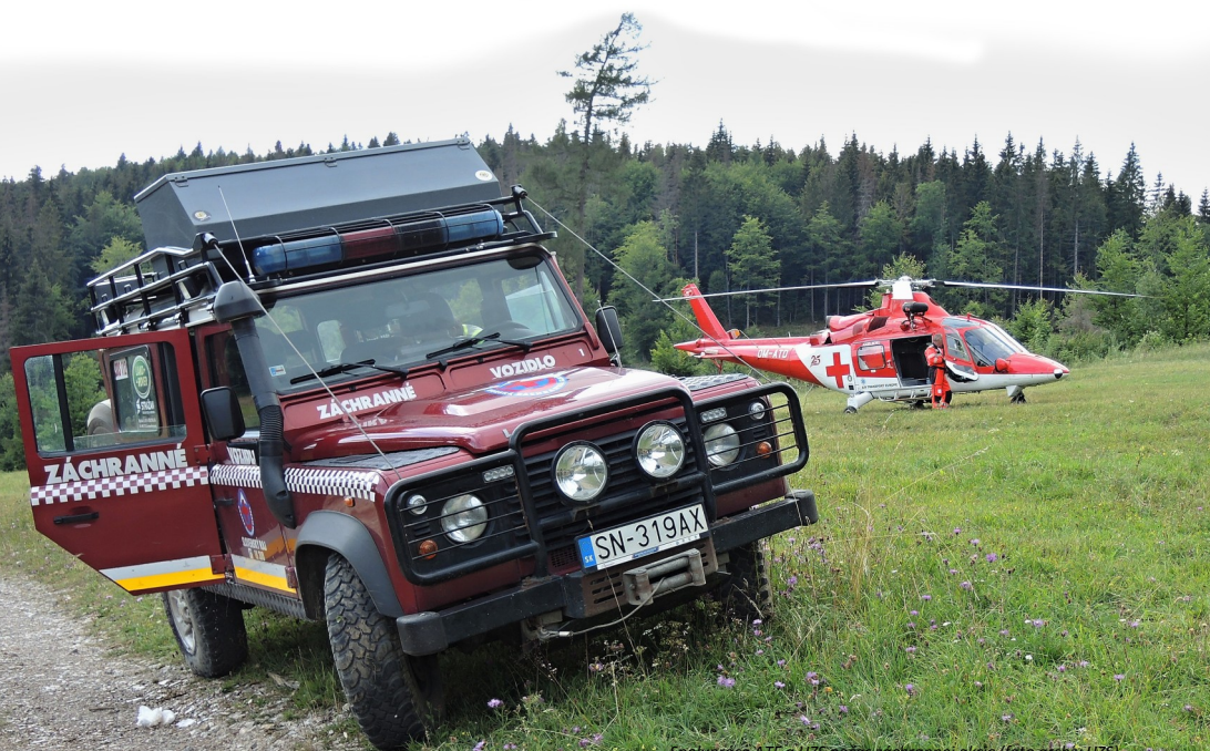
Spolupráca ATE a HZS počas záchrannej akcie

Posádky ATE zasahujú najmä pri úrazoch v horských oblastiach, v lesných terénoch na odľahlých lokalitách, pri dopravných nehodách, záplavách či hromadných nešťastiach. Vrtuľníky sa často využívajú aj pri neonatálnych a iných medzi-nemocničných prevozoch pacientov a transportoch pre transplantačný program.