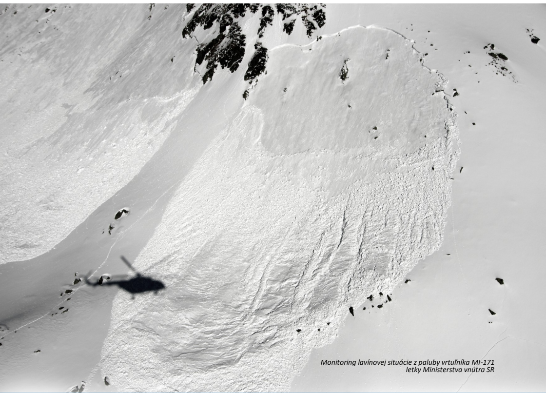
Monitoring lavínovej situácie z paluby vrtuľníka MI-171 letky Ministerstva vnútra SR

Ideálne je nikdy sa do lavíny nedostať. Dôležité je vyhýbať sa lavínovým terénom a mať kompletnú lavínovú výbavu (lopatka, sonda a vyhľadávač). Platí tu už spomenuté pravidlo: „Čas je život“ 2 .